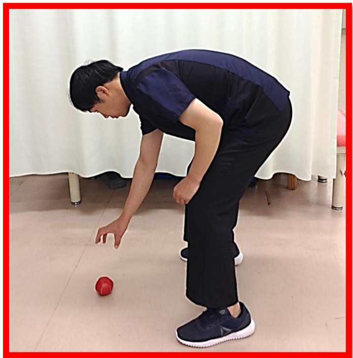
かがみ動作で作業・移動を続ける