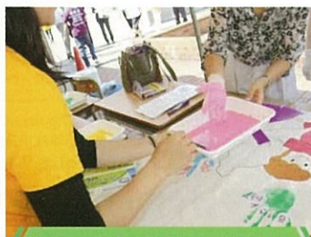
楽しい企画がたくさん!