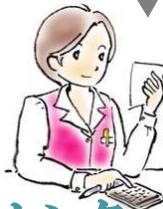
検収センター 電話3577