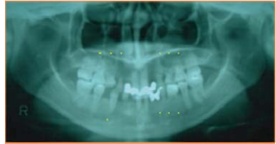
写真3 当科へ紹介時のパノラマ X線写真