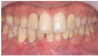
写真 6 プロビジョナルレストレーション装着 (平成 19 年 12 月初旬)