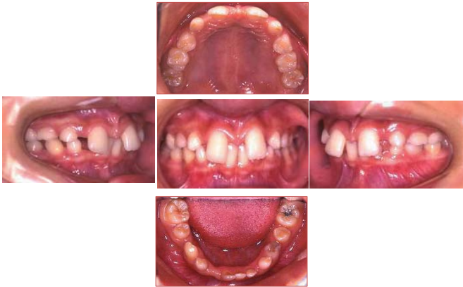
写真1 連携登録医における初診時の口腔内写真

平成18年4月 インプラント治療に対する精査加療を目的に当科を紹介され受診した。