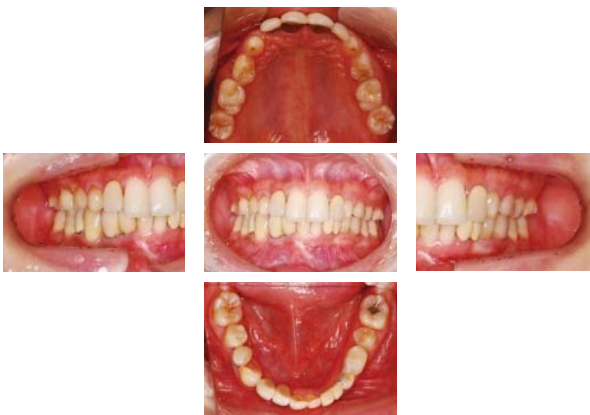
写真 7 最終補綴物装着後の口腔内写真 (平成 20 年 1 月初旬)