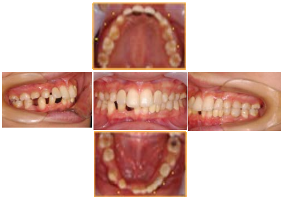
写真2 当科初診時の口腔内写真