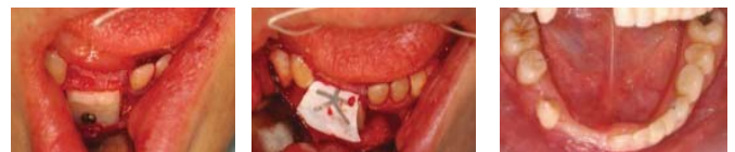
写真4 骨増生術中・術後の口腔内写真 (平成18年9月中旬)