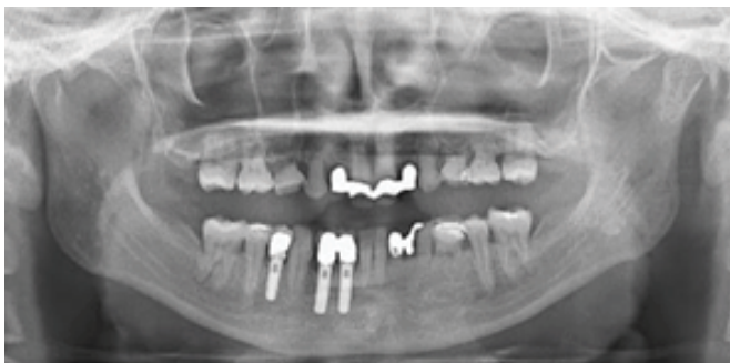
写真 8 最終補綴物の装着から 2 年 3 か月後のパノラマ X 線写真(平成 22 年 4 月初旬)