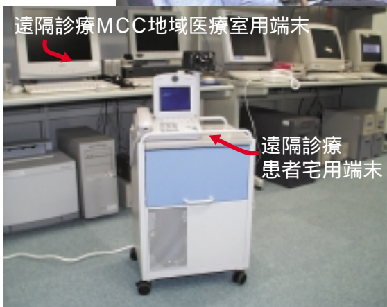
遠隔診療MCC地域医療室用端末

サイン伝送ネットワークシステムは、救急現場の状況を現場映像でリアルタイムに共有しながら、医師が現場の救急隊員（救急救命士）に指示を与えたり、医師派遣が搬送優先かの判断などを行うほか、災害規模を把握してその対応策を即時に検討できるというもの。4台の救急車への対応が可能で、大学病院は災害時医療や地域救急体制に重要な役割を果たせるようになり、今後の実用化に向けて期待が集まっている。