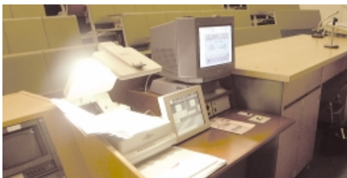
講義室に設置された講師用モニターと制御装置

うな急性期から生活習慣病のような慢性疾患まで、さらに十分な時間をかけた治療が必要な心療内科的なケースや、集中治療部における高度先進医療が必要なケースなど、非常に広範におよんでいる。これは地域住民の幅広いニーズに応えるだけでなく、学生たちにとっても最良の医学教育の場となるはずである。