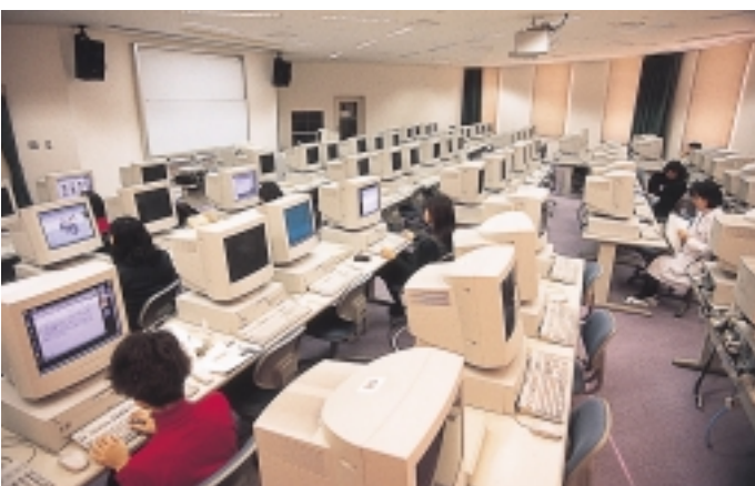
76台の端末を設置した演習室

今まで分散して個々に蓄積・活用されていた附属病院と大学をうまくつないでデータを共有するだけでなく、他の医科大学や医療機関とも情