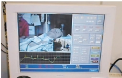
パソコンの画面で、在宅患者さんを24時間モニターすることができる。