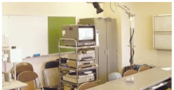
放送設備や映像編集装置などが導入された。

学部学生の講義 実習および臨床研修医のチュートリアル 各大学の特色を生かした教育用