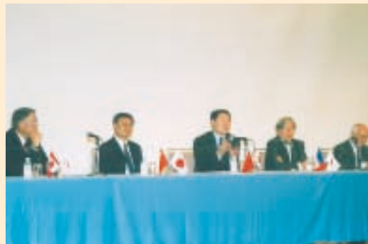
記念国際シンポジウム

いただき、式典を終了しました。また引き続き行われた記念祝典では、多数の来賓からお祝いのスピーチをいただき、鏡開きなどが行われて華やかな雰