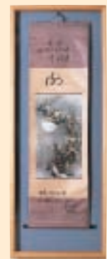
2004年 滋賀医科大学 (中国) 贈