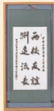
「高校友誼贈送巻」 創製 2004年 滋賀医科大学 (中国) 贈