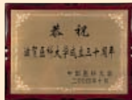
祝賀状 2004年 滋賀医科大学 (中国) 贈