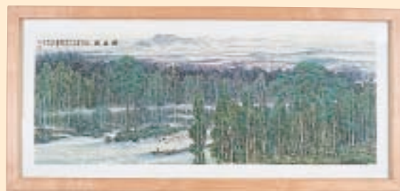
梅葉園 寄贈作 2004年 滋賀大学 (中国) 贈